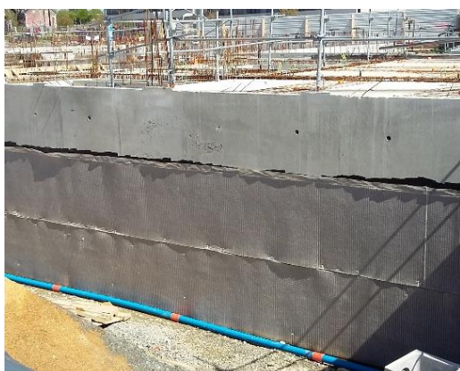
Pose de l'ALVEODRAIN Ev en lés horizontaux